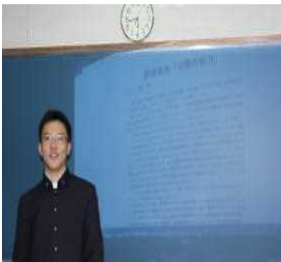
近鉄についての報告です

とくにファン泣かせである複雑な車両形式について、自身が撮った写真を示しながら解説してくれました。一見するとまったくといていいほど同じ顔をしているのに、形式はまったく違う。その一つの理由は、つけている台車が違うからなど、分かりやすい説明を部員にしていました。