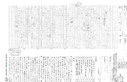
読書感想文添削例

取り組みの成果としては、読書から本への興味が深まり、本から得たことを自分の言葉で表現する力を向上させている。